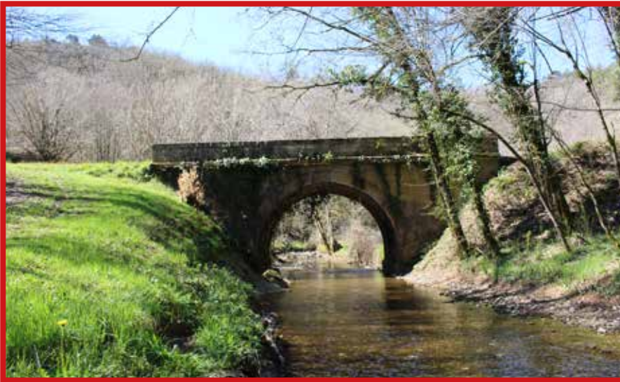
Le Taravellou sous le pont de Bord.

Le Cern fut poissonneux. Il y a quelques années, les truites remontaient en amont du Durand et du Taravellou, ce qui faisait le bonheur des pêcheurs. Quant au Douime, ce ruisseau sauvage pullulait d'écrevisses, de vraies écrevisses goûteuses naissant et grandissant sur le site. La pêche de ces crustacés était autorisée sur deux mois environ (de mi-août à mi-octobre).