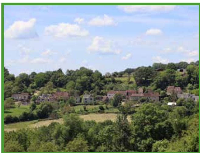
Le hameau de Rodas.

La roda en occitan c'est la roue du moulin. Mais aucun ruisseau ne peut mouvoir ici une roue de moulin et, bien qu'en hauteur, le hameau ne garde aucune trace ou souvenir d'un moulin à vent. Roda est également la roue de la charrette et on peut imaginer qu'un fabricant de bonnes roues (rodas) ait laissé sa marque dans un hameau qui est proche d'une grande voie de circulation nord-sud. Mais le plus simple reste d'envisager que le nom de ce hameau vient de l'occitan « roda » qui signifie buisson, clairière).