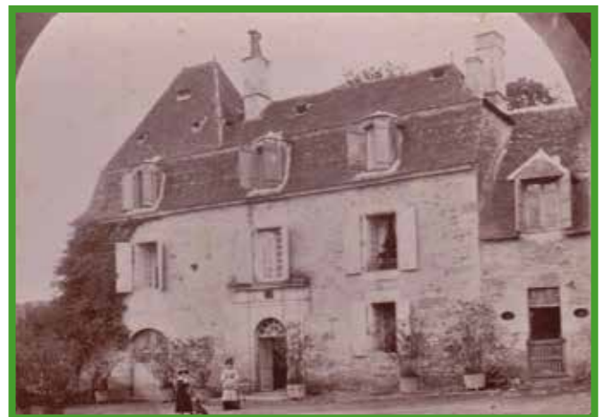
Le Jarry en 1900.