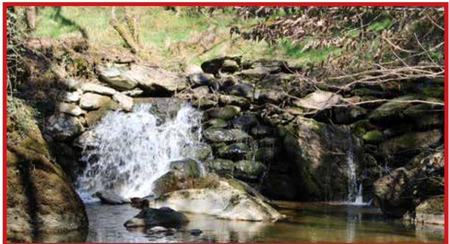
Une cascade du Taravellou.

Cern et ses affluents depuis Azerat jusqu'au confluent à Condat. Il existe donc un plan de prévention inondation sur la commune de Saint-Rabier. L'élaboration