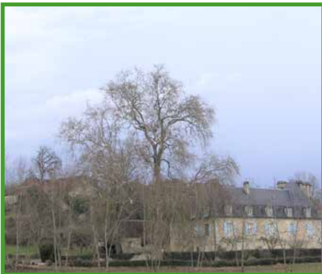
Le Jarry aujourd'hui.

Le Jarry est un nom très répandu dans l'ouest de la France et en Périgord. Les nombreuses variantes (Jary, Le Jary, Le Jaris, Le Jarit, Genry, Jari, Jare, Le Garric, Le Jaric, Le Jarie, Le Garic) renvoient toutes au fait qu'à une époque lointaine, l'endroit hébergeait un chêne remarquable ou était planté de chênes.