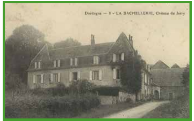
Le Jarry en 1908.

Au Moyen-Âge, au début du XI ème siècle, la paroisse de Saint-Rabier appartient à la châtellenie d'Ans. Elle a pour seigneur l'abbé de Terrasson. Elle compte de nombreux châteaux, demeures nobles et manoirs, notamment le manoir du Jarry.